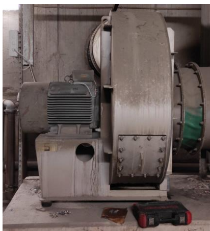
Фиг. 1 Аксиален вентилатор в инсталация за сушене на отпадъци.

Трудностите, особено след ограниченията наложени от Ковид-19 и последващата деградация на веригите за доставка от Китай, в комбинация с наложените ограничения за доставка на тежко оборудване и материали от Русия, след началото на провеждане на специалната военна операция на територията на Украйна, „постави на колене“ редица производства и предприятия поради затруднения при доставка на резервни части, планиране и провеждане на ремонтни дейности.