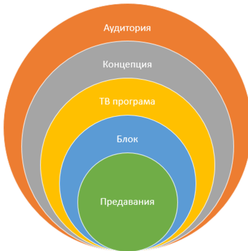
Фиг. 2. Алгоритъм за описание на образователна ТВ програма.

В тази връзка предлагаме следният обобщен алгоритъм за описание на програмата за образователна ТВ: