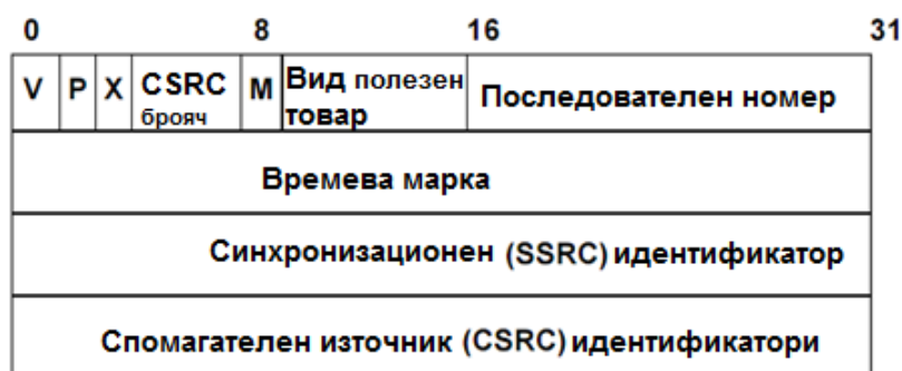
Фиг. 2 Форма на заглавие на RTP пакет

първоначално е разработен за множествени мултикаст сесии. В допълнение на ролята на изпращач и получател, RTP също дефинира ролята на преводач и смесител, за да поддържа изискванията за мултикаст. Протоколът RTP е VoIP компонент с критично значение, защото той позволява на устройството по местоназначение да изпрати заявка за повторно изпращане на пакетите преди те да бъдат предадени към потребителя. Кадърът на RTP е съставен от хедър, съдържащ времева марка и пореден номер, което позволява на получаващото устройство да буферира и джитера и латентността, чрез синхронизиране на пакетите да възпроизвеждат продължителни потоци от звук. Протоколът използва поредни номера, за да поиска пакетите отново. При RTP не се изисква предаване отново, ако даден пакет е изгубен. Когато пакетите, пренасящи глас попаднат в мрежата, за да достигнат своята дестинация, те може да поемат по един или повече пътища. Всеки път може да има различна дължина и скорост на предаване, което може да доведе до достигането на пакетите в неподреден вид при крайното устройство. Когато пакетите се изпращат към преносната среда от устройството – изпращач, RTP поставя етикети на пакетите с времева марка и пореден номер. При устройството – получател RTP може да подреди отново пакетите и да ги изпрати към цифровия процесор (DSP – Digital Signal Processor). Хедърът на RTP пакет се състои от 16 байта. Първите 12 байта са задължителни. Формата на заглавието на RTP пакет е представена на фигура 2: