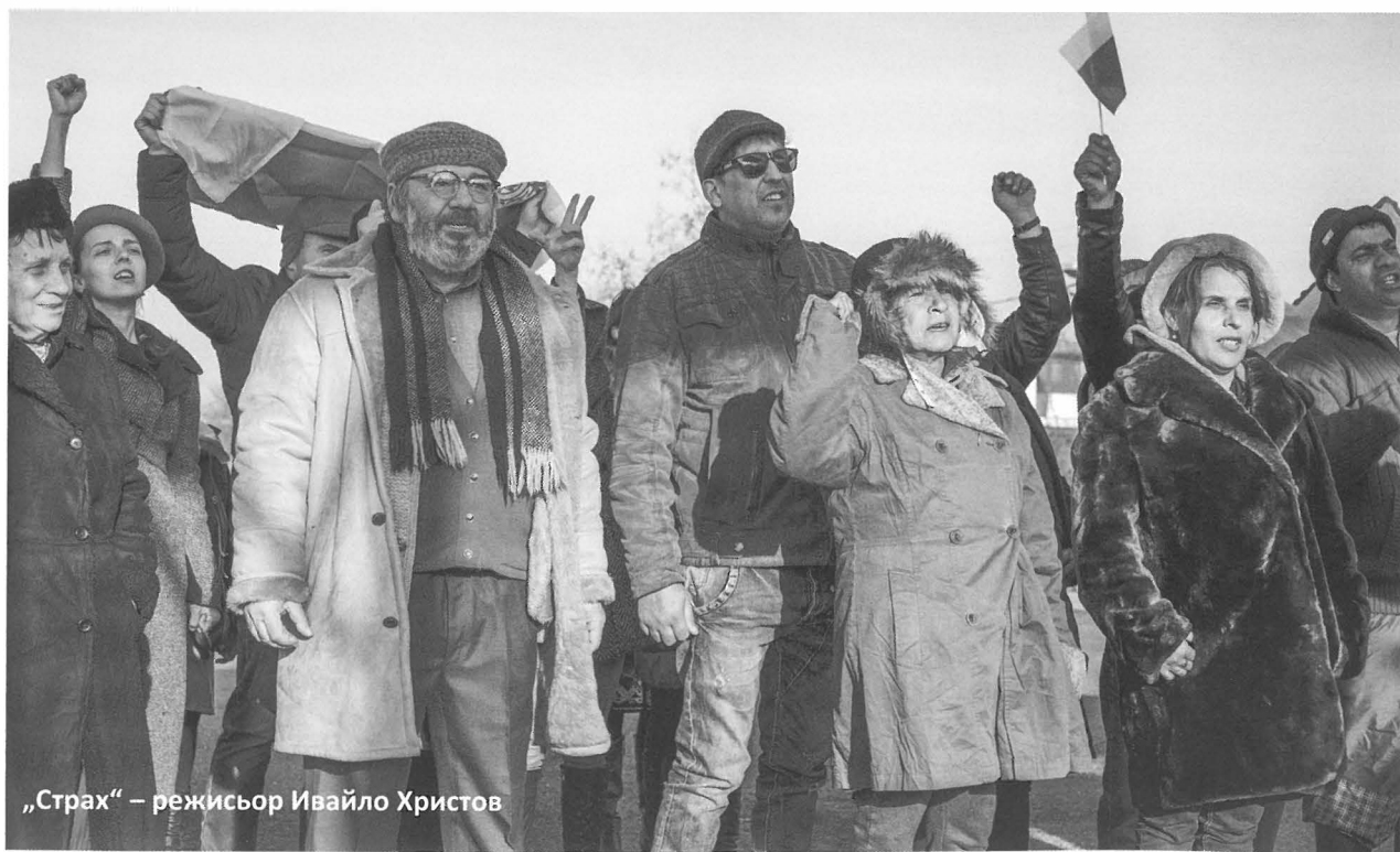
„Страх“ – режисьор Ивайло Христов

И за да преодолеем, поне на хартия, „призраците на нашите страхове“ ще спомена още два филма.