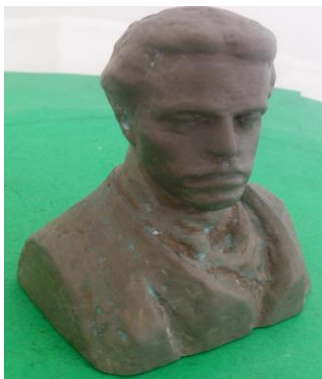
Фиг.1. Статуетка на Васил Левски.

Броят на приложенията за 3D принтери се увеличава с всяка година. 3D принтерите използват за печат различни материали като пластмаса, метал, имитация на стъкло, титан, сребро или злато, био тъкани, дори и шоколад. Екипът от учени в университета на Южна Калифорния разработи метод за създаване на къщи чрез 3D технологията[14]. Учени от Вашингтонския университет вече отпечатват заместващи кости за пациенти, които имат нужда от ортопедични или дентални процедури. Отпечатването на десерти има огромно значение за хранителната индустрия. В момента учени от различни лаборатории по света също търсят най-подходящият начин 3D принтерът да анализира различните физически и здравни параметри на човек, за да може сам да определя хранителните потребности на различните хора. В обозримото бъдеще скенер ще взема точните пропорции на човешкото тяло и ще отпечатва дрехи не само според предпочитанията на клиента, но и с точни индивидуални размери [12,13].