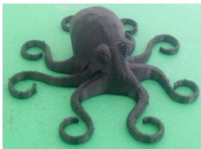
Фиг. 3. Октопод след 3D моделиране.