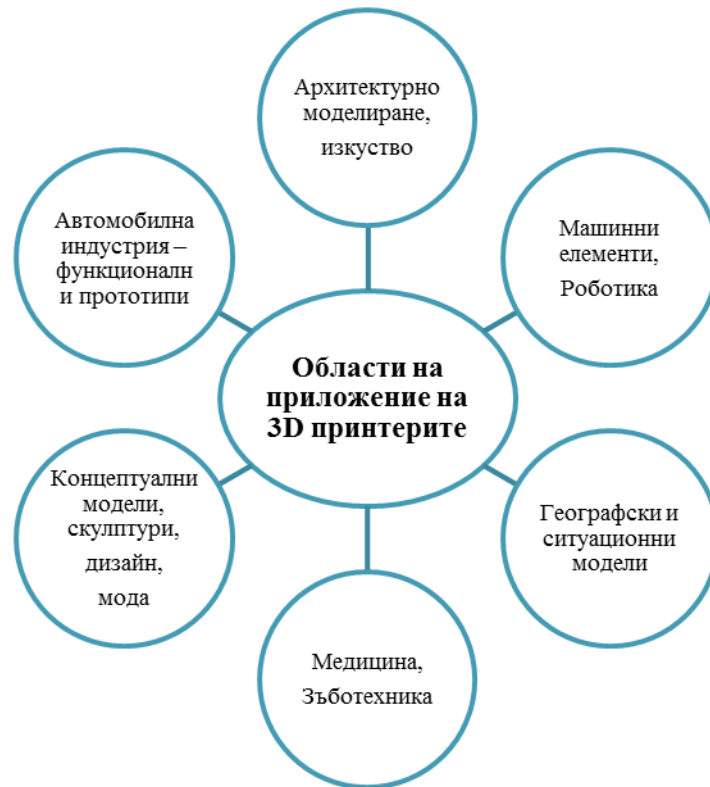
Фиг. 5 Области на приложение на 3D принтерите.