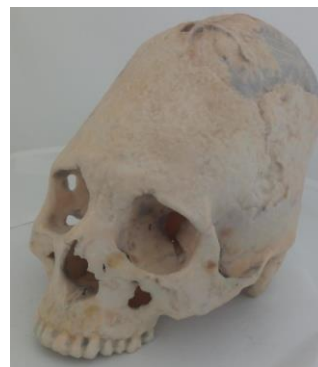
Фиг. 2. Череп след 3D моделиране.